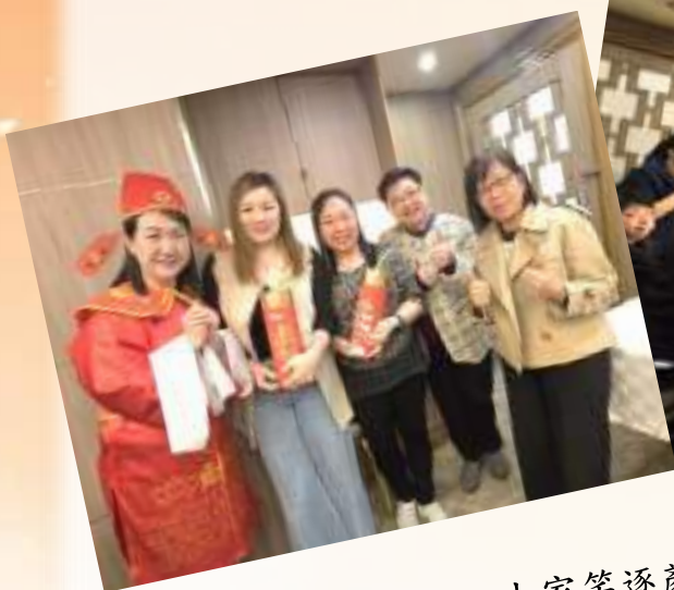
校長及財神送上抽獎禮物，大家笑逐顏開。

校長與家長齊吃開年飯，有39位家長踴躍參加。當日更設有抽獎環節，家長們皆大歡喜，喜氣洋洋。